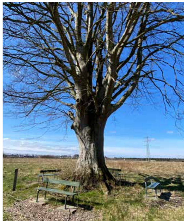
En nem måde at minimere en risiko ved dette træ, vil være at fjerne bænken.