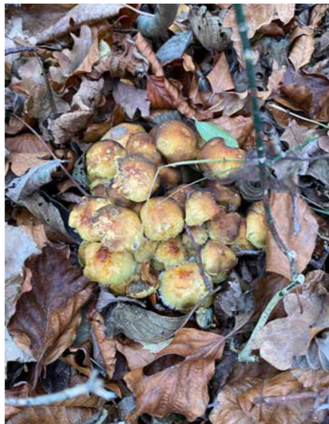
Honningsvamp, som særligt svækker træets rødder. Man kan observere svampene i efteråret.