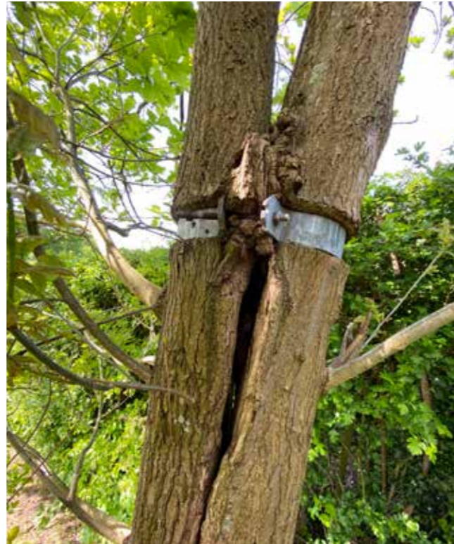
Et egetræ med indgroet bark, der har resulteret i en hulhed. Her er også et mislykket forsøg på at stabilisere de to stammer.