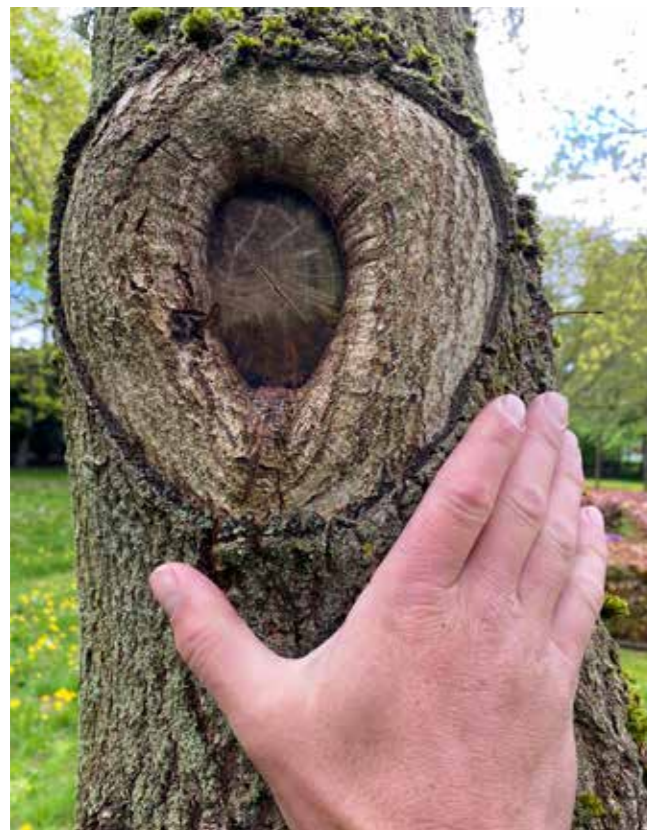
Størrelsen på den afskårne gren gør at træet har svært ved at lukke såret, og træet er åbent for råd og svamp.