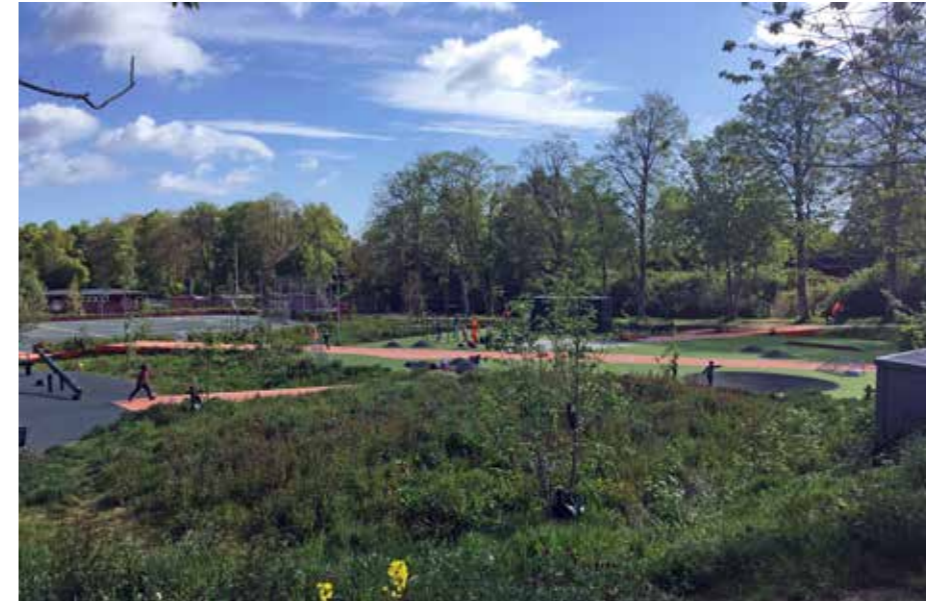
Aktivitetsskoven modtager regnvand i skybrudssituationer, hvor vandet kan nedsives i lavninger. Mellem søer og lavninger, er der lysninger med plads til boldspil, leg og bevægelse.

Området dækker 3 forskellige kvarterer – Skovkvarteret (parcelhuse) + Aktivitetsskoven, Allékvarteret (murerstervillaer) og Bykvarteret (den gamle bydel), hvor regnvandet håndteres på forskellige måder. Der er skabt nye multi-funktionelle byrum, som samtidig kan håndtere den forventede ekstremregn der falder i fremtiden. Klimatilpasningsløsningerne er tilpasset de forskellige kvarterer, hvor regnvandet bliver et synligt urbant element i byen. Ved at integrere klimatilpasning med byudvikling, får man skabt en levende by, der ikke kun er grønnere, sundere og mere sjov at bo i, men også er klimaresilient og forberedt på fremtidens klimaforandringer.