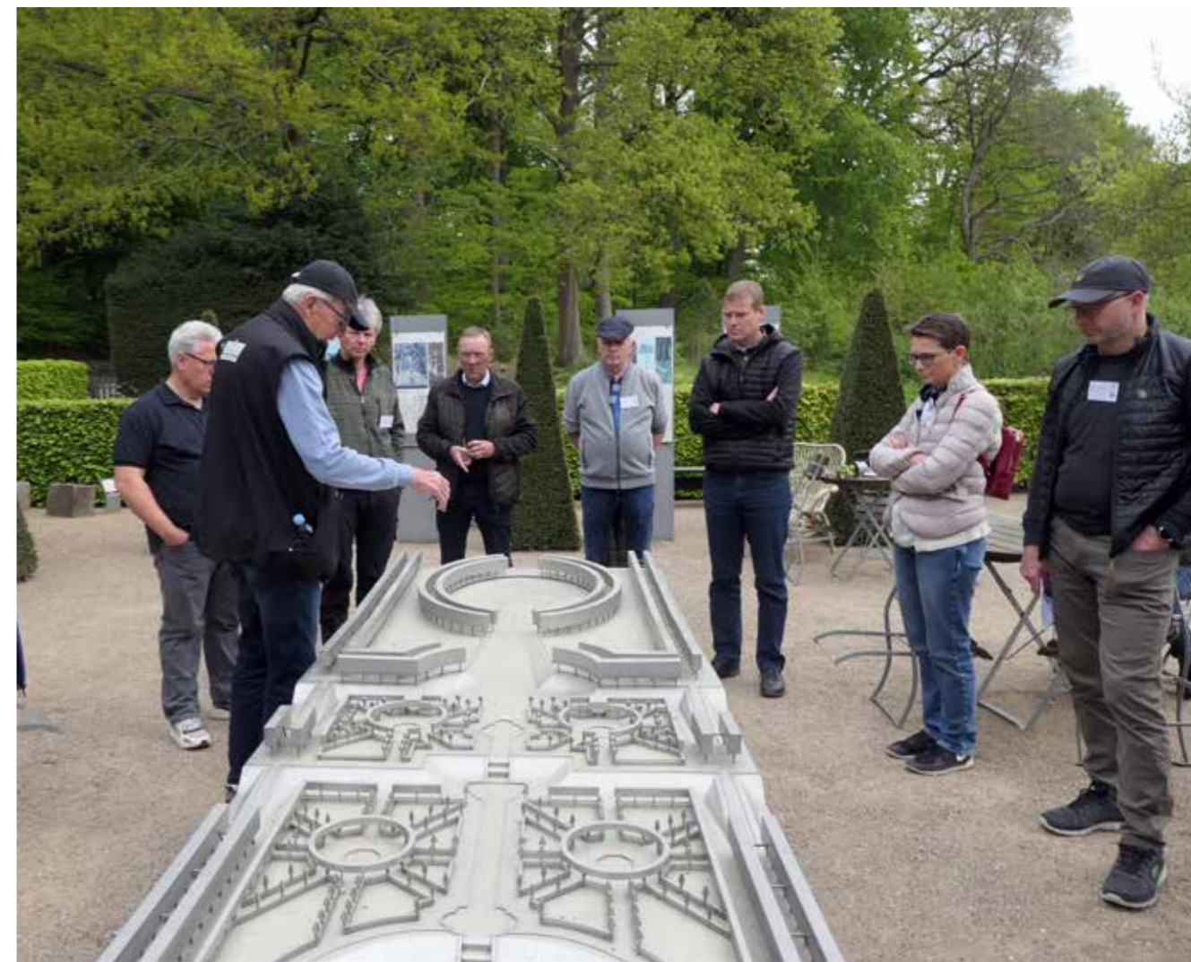
Rundvisning i Barokhaven ved guider fra Barokhavens Venner, der her fortæller om barokhavens opbygning.

ceret i ovalens omkreds, findes de mere traditionelle gravstedstyper. Langs diget, som omkredser kirkegården, er der gravsteder i græs for urner og kister, hvor gravmindet er en sten i diget. Der arbejdes i øjeblikket på at lave udviklingsplaner for de tre kirkegårde i Hillerød kommune; de blev præsenteret under rundvisningen – og vil blive beskrevet i et kommende nummer af KIRKEGÅRDEN.