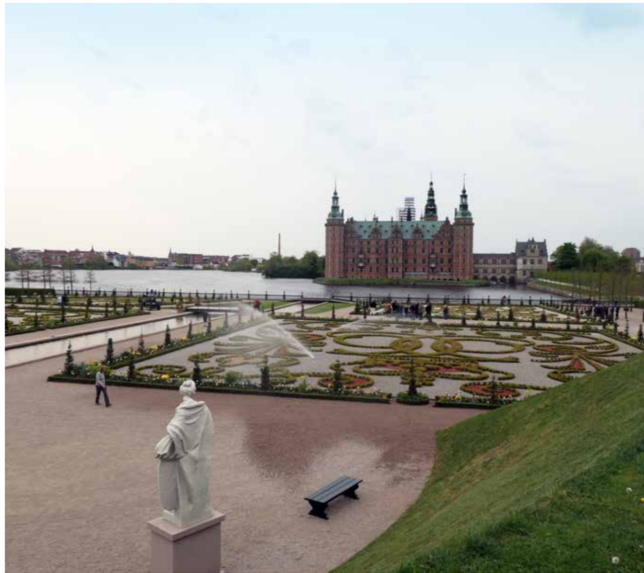
Monogrammerne og en af de zinkskulpturer, der er kopier af originale sandstensskulpturer fra 1800-tallet.

forskel på 14 meter fra det højeste til det laveste trin. Ud for det laveste kaskade trin ligger broderiparterret, hvor 4 regenters monogrammer er "broderet" i buksbom, stålkanter og skærver i 2 forskellige farver. Monogrammerne repræsenterer de 4 regenter, der har haft en betydning for havens historie: