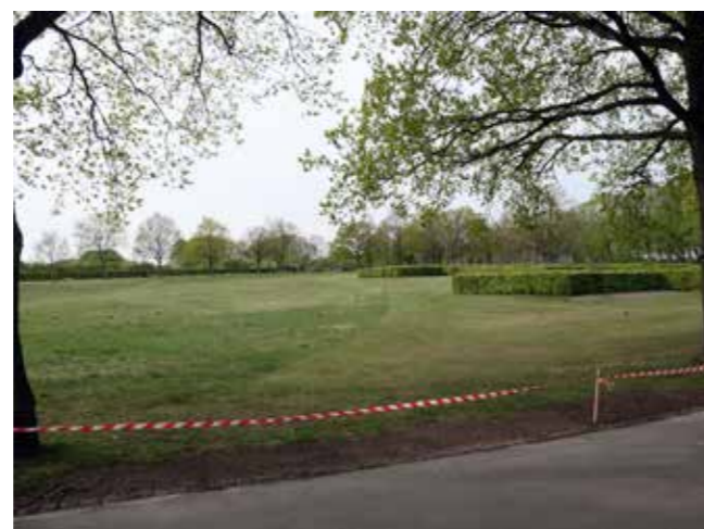
Gravsteder langs diget, der omkranser den næsten ovale kirkegård.