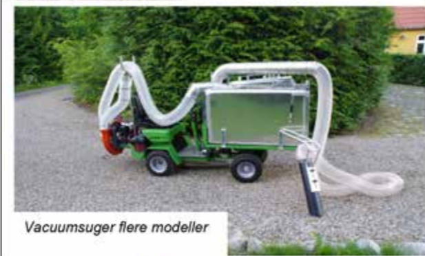
Vacuumsuger flere modeller