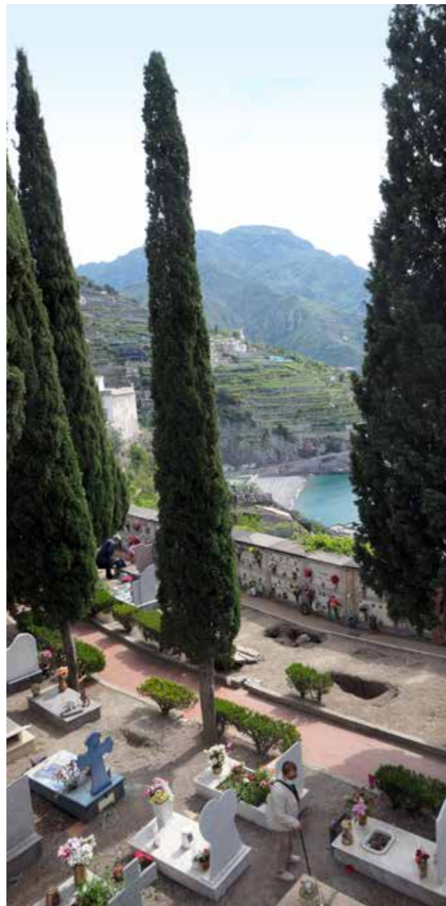
Der er mulighed for at blive jordbegravet i kiste.