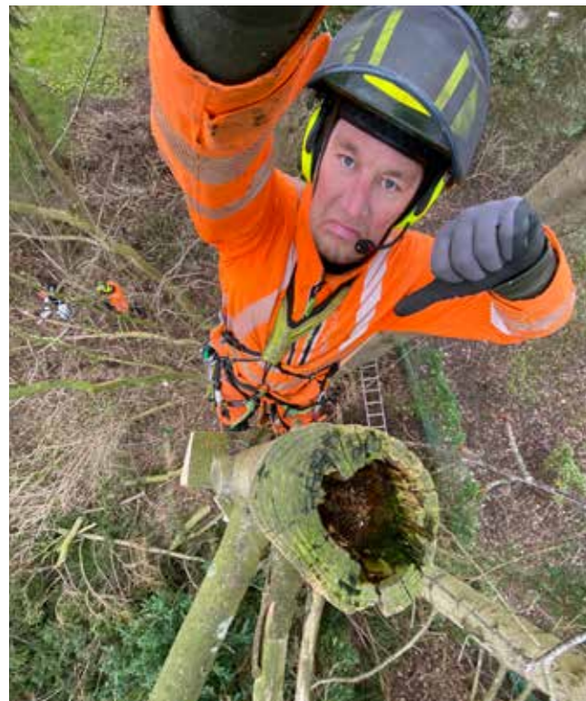
Topkapning har resulteret i udbredt råd i træet.