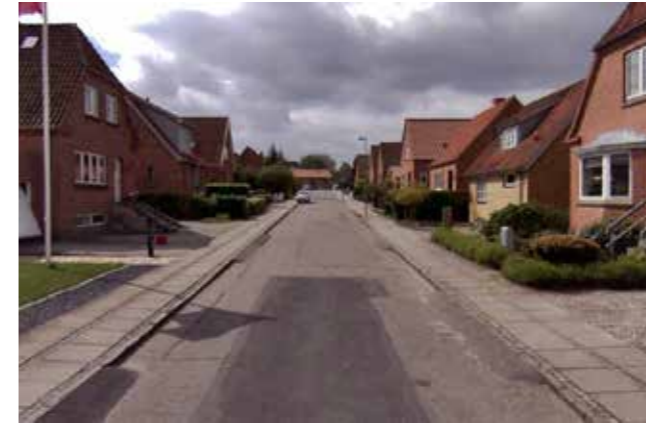
Egevej i Allékvarteret før og efter klimatilpasning: Fortovene i begge sider er fjernet for at give plads til regnbede, hvor der er plantet egetræer. Overløb fra regnbenedene i Allékvarteret ledes på overfladen ned over Vestre Kirkegård og er suppleret med en overløbsledning, så oversvømmelser på kirkegårdens arealer undgås.