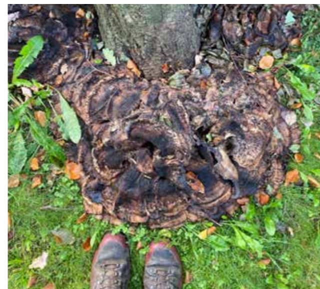
Kæmpeporesvamp på bøg.

"Der er flere ting der spiller ind når et træ udvikler sig til et risikotræ. For de flestes vedkommende er det noget vi mennesker gør, der skader eller svækker træernes naturlige vækst og styrke"