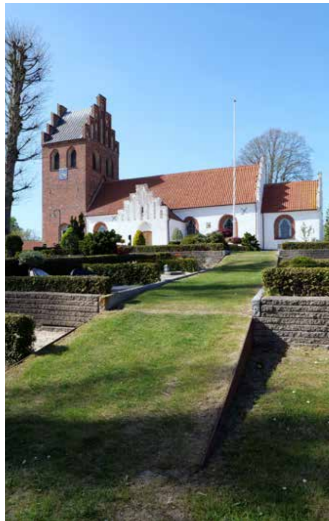
Helsingørskirken med omlagt gang i forgrunden.