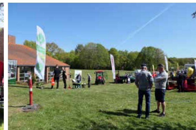
Leverandørudstilling i de grønne omgivelser ved Hotel Bymose Hegn.