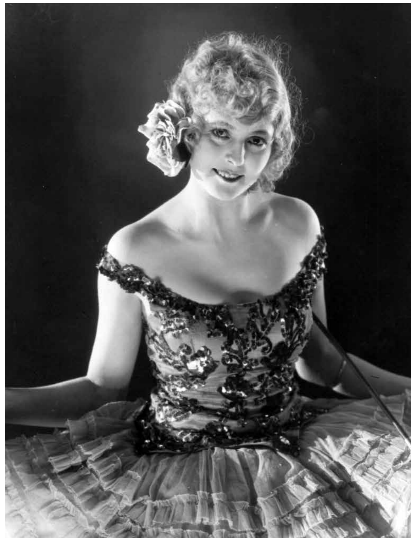
Karina Bell medvirkede i 21 spillefilm i perioden fra 1921 til 1933 og var indbegrebet af det kvindelige skønhedsideal på film i 1920'erne.

Indtil Helsingør Kirkegård fik sin egen klokke, kunne der bestilles ringning med St. Olai eller Sct. Mariæ kirkers klokker. Omkring år 1950 kostede det 24 kr., hvis der skulle ringes med klokkerne i St. Olai Kirke i forbindelse med en begravelseshandling i kapellet på Helsingør Kirkegård. Der blev så ringet 10 minutter før og efter begravelseshandlingen. I praksis foregik det på den måde, at kapelbetjenten i kapellet gav signal til klokkeringning ved at vinke med et hvidt lommetørklæde. Kirkebetjenten i St. Olai stod klar ved kirketårnets glanhuller og kunne så starte ringningen på kapelbetjentens signal. I tæt tåge eller