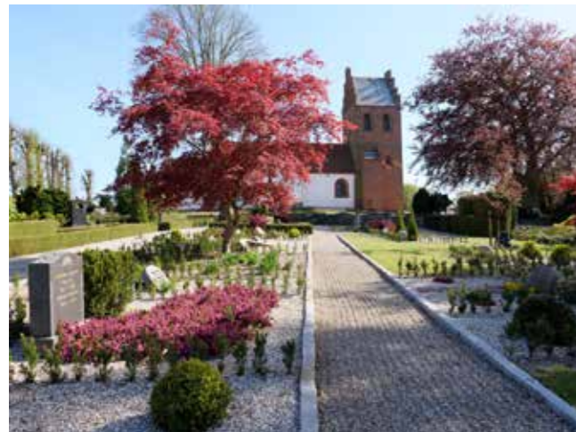
Helsingørskirkegården og omlagte gravsteder med nye forkanter og gravstedshække.