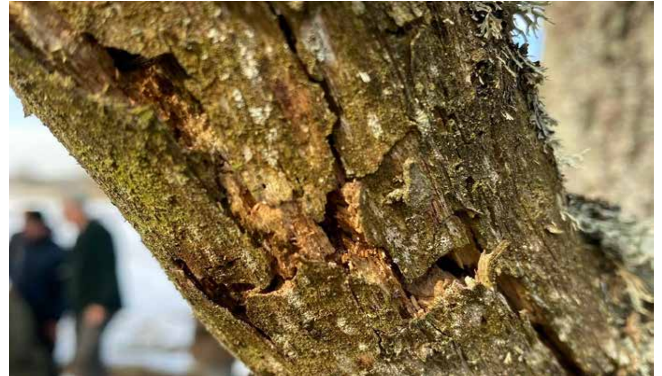
Det er ikke altid de store tegn der viser sig, derfor er det vigtigt at komme tæt på.