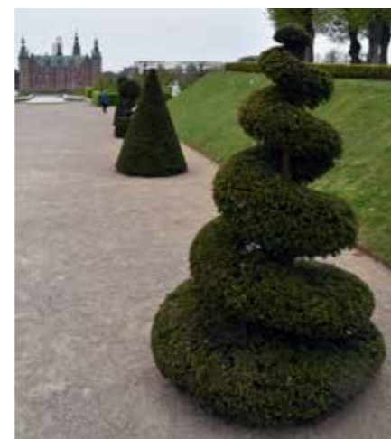
Slotshaven ved Frederiksborg Slotshave består af to forskellige haveanlæg: Barokhaven og Landskabshaven. Barokhaven imponerer med sine skarpt klippede taks og buksbom, de snorlige hække og de stramme, symmetriske linjer.