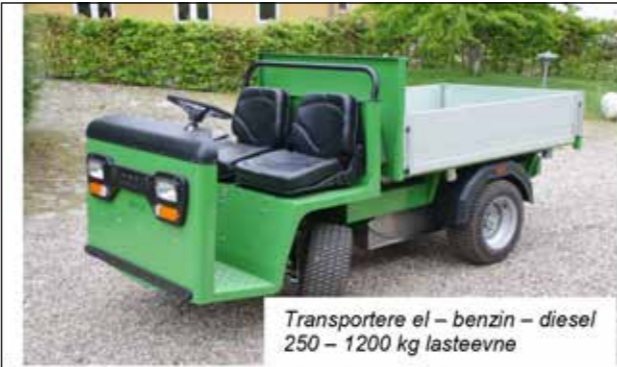
Transportere el – benzin – diesel 250 – 1200 kg lasteevne