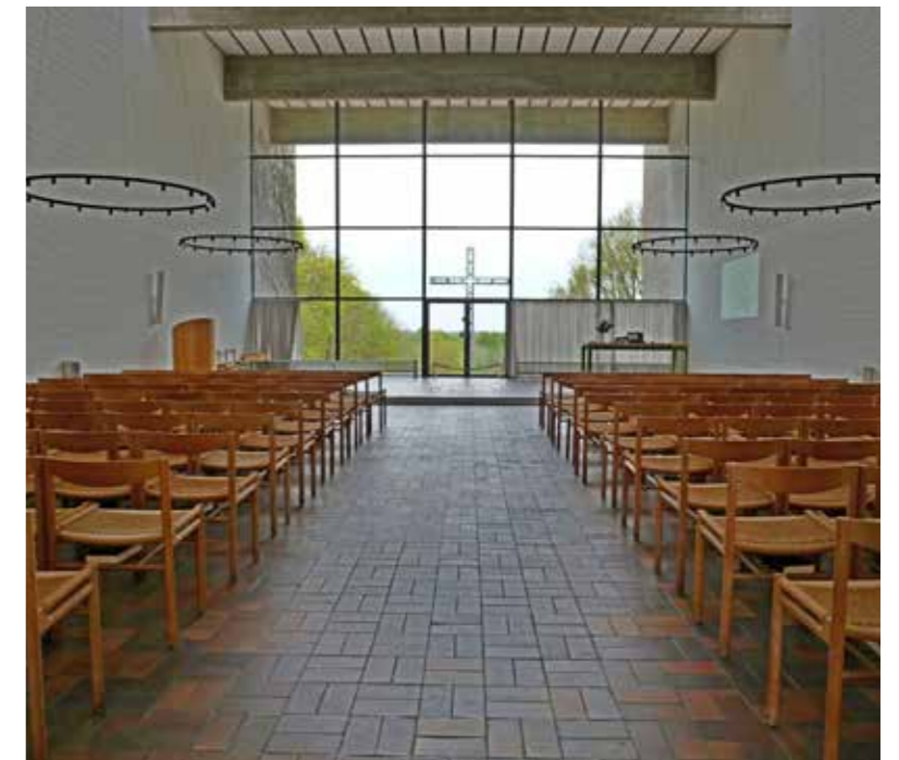
Skansekapellet fremtræder som en markant bygning, hvor murerne er dækket af vildvin. Fra kapellet er der en flot udsigt over landskabet.