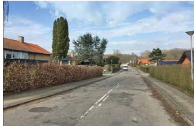
Karensvej i Skovkvarteret før og efter klimatilpasning: Vejen er koblet fra fælleskloakken og regnvandet ledes nu til regnbede med spredte træer og en beplantning, der har et naturligt udtryk. Ved skybrud ledes regnvandet videre til Aktivitetsskoven.