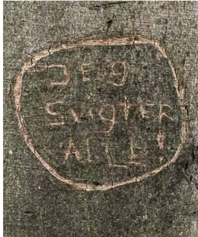
Snit ikke unødvendigt i træerne.