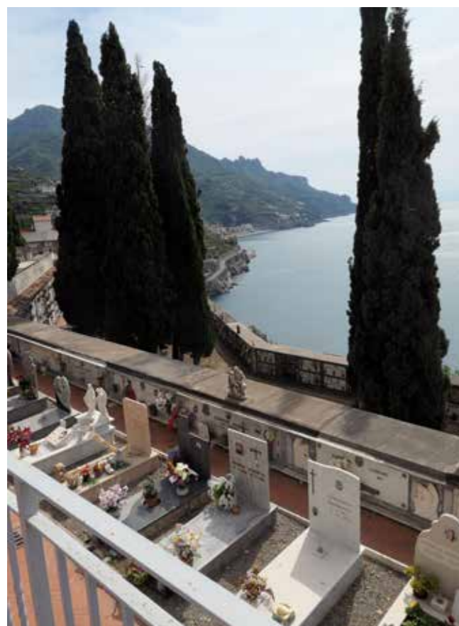
Kirkegården er i 3 "etager" – og fra øverste etage er udsigten helt fantastisk!