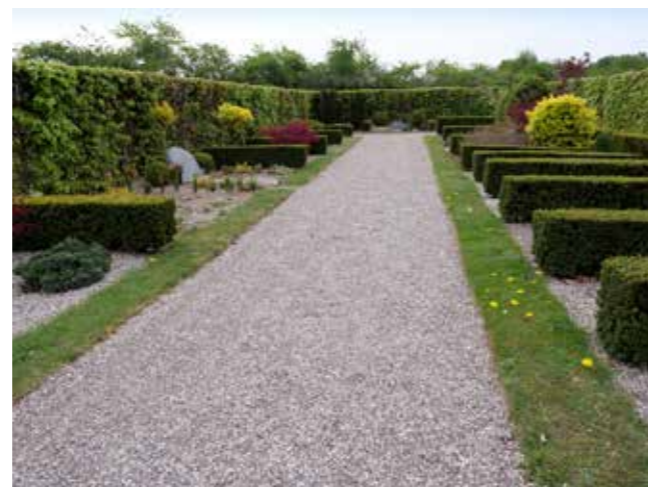
Forskellige typer af gravsteder på Skansekirkegården.