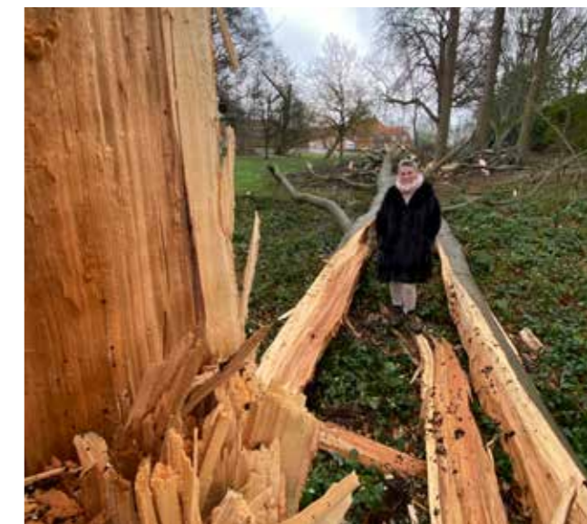
Bøgetræ væltet i stormen Malik grundet råd.